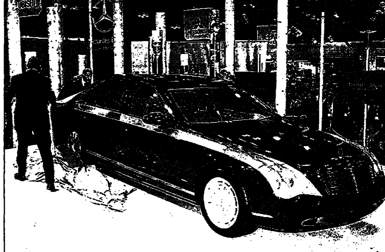
يورغن شروبيج رئيس شركة مرسيدس بنز يكشف الغطاء امس في طوكيو عن سيارة ميايخ الجديدة

القاهرة - رويترز: أعلنت شركة كازاخويل الوطنية امس الاربعاء ان كازاخستان بدأت في 1997 في زيادة انتاجها النفطي بهدف الوصول الى المرتبة السادسة عالميا في الانتاج في غضون عشرة اعوام.